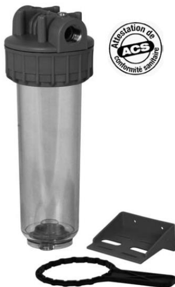
Filtr PS ACS 3 części, przezroczysty pojemnik, z wkładkami, do wody zimnejj