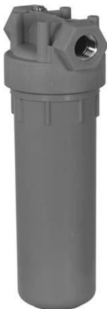
Filtr HH 2 części, nieprzezroczysty pojemnik, z wkładkami, do wody ciepłejj